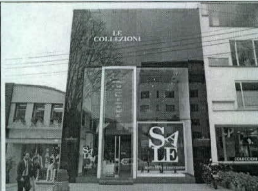
Foto 14. Local comercial donde se ubicaba el almacén "Hernán Zajar".