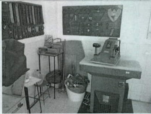
Foto 9. Troqueladora empleada en el proceso y recolección de retazos producidos.