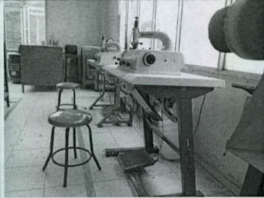
Foto 10. Desbastadoras y método de recolección de residuos.