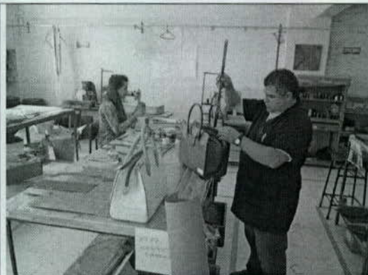
Foto 8. Actividades de confección de productos.