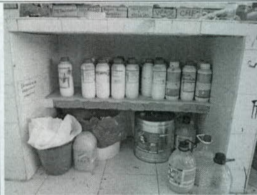
Foto 11. Área de manejo de soluciones de caucho y tinturas para terminado.