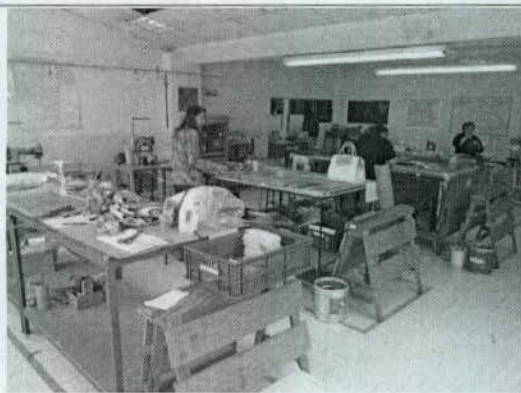
Foto 7. Vista general del taller de manufactura.