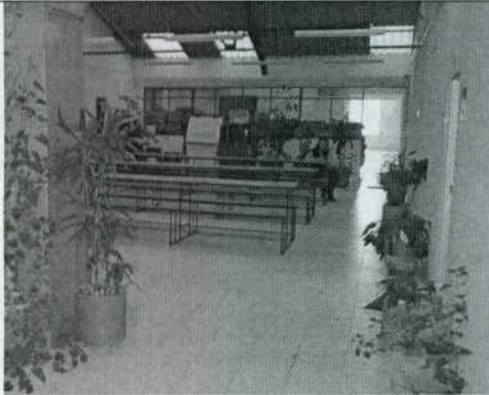
Foto 1. Zona de acceso al espacio ocupado por Yuma Crocodile Products.