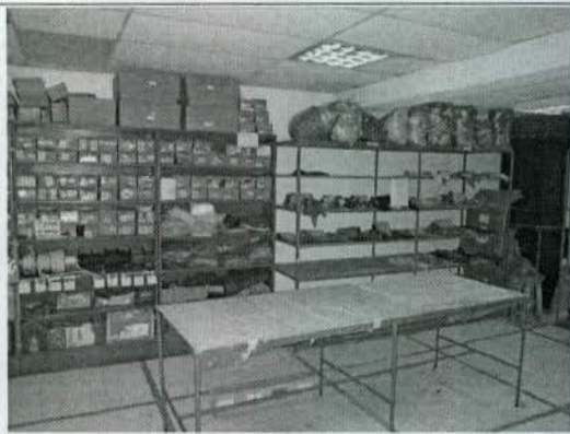
Foto 5. Almacenamiento de materias primas e insumos dentro de la bodega.