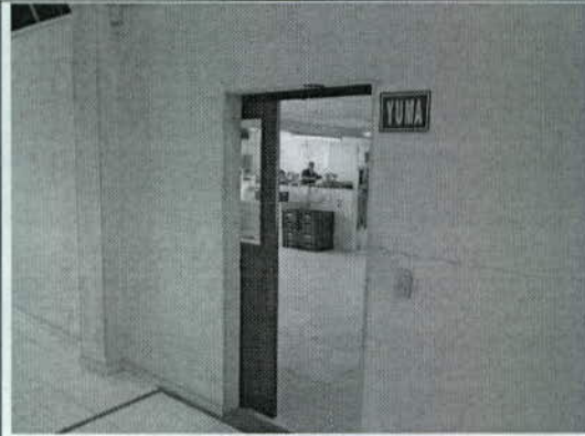
Foto 2. Puerta de acceso a la empresa.