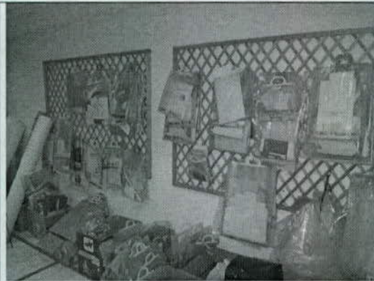
Foto 6. Moldes empleados en el proceso de corte de materiales.